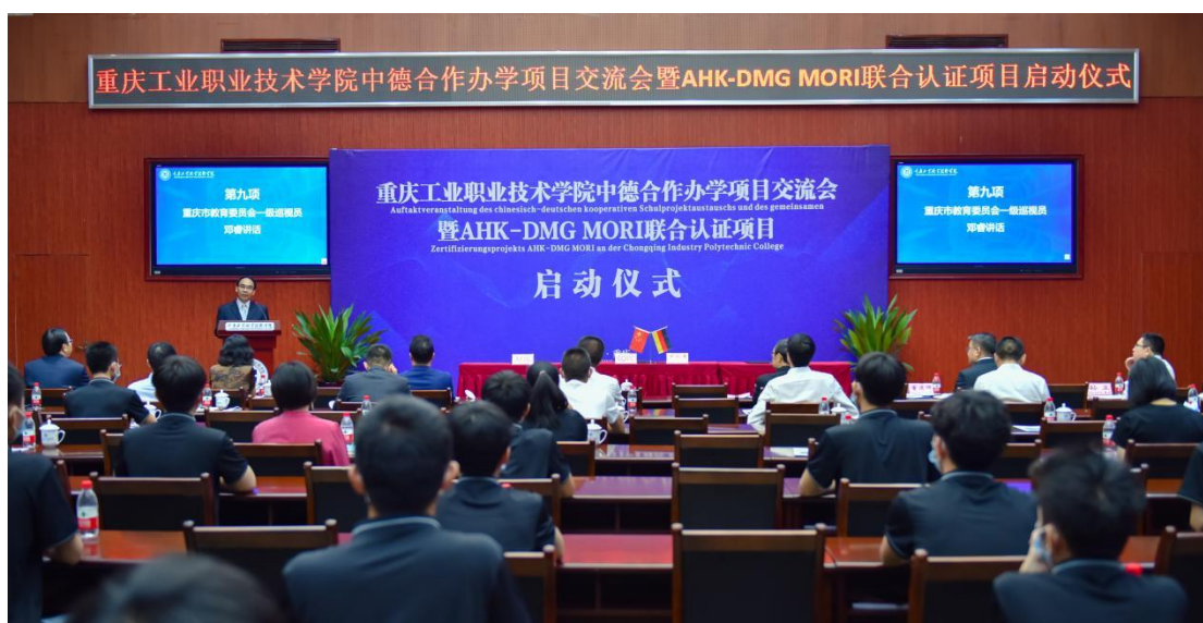
中德合作办学项目交流会暨 AHK-DMG MORI 联合认证项目启动仪式

表参加，包含来自新加坡、马来西亚、菲律宾等国家的 25 所境外院校代表、20 家企业代表共计 200 余人，线上图文直播浏览量达 80 余万人次。该联盟现已吸纳 151 家会员单位，其中院校单位 124 个，包含 26 个外方院校单位，涉及 12 个国家 1 个地区，企业单位 27 个。