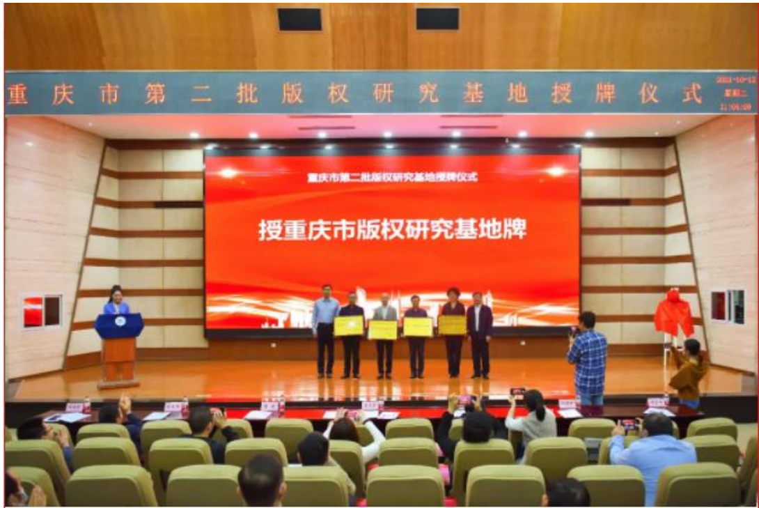
重庆市版权研究基地落地学校授牌仪式现场

继续教育师资队伍不断加强。 基于学生创业培训需求的增加以及重庆工业职业技术学院老年大学教学需求，学校积极完善培训师资库建设，共完成 26 名专兼职培训名师入库。