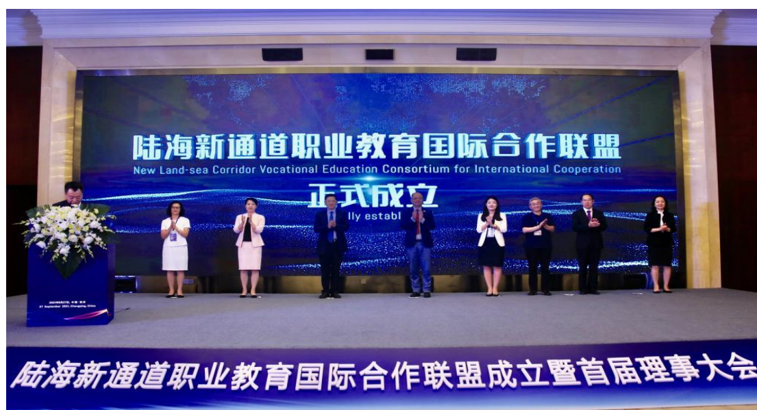
陆海新通道职业教育国际合作联盟成立暨首届理事大会