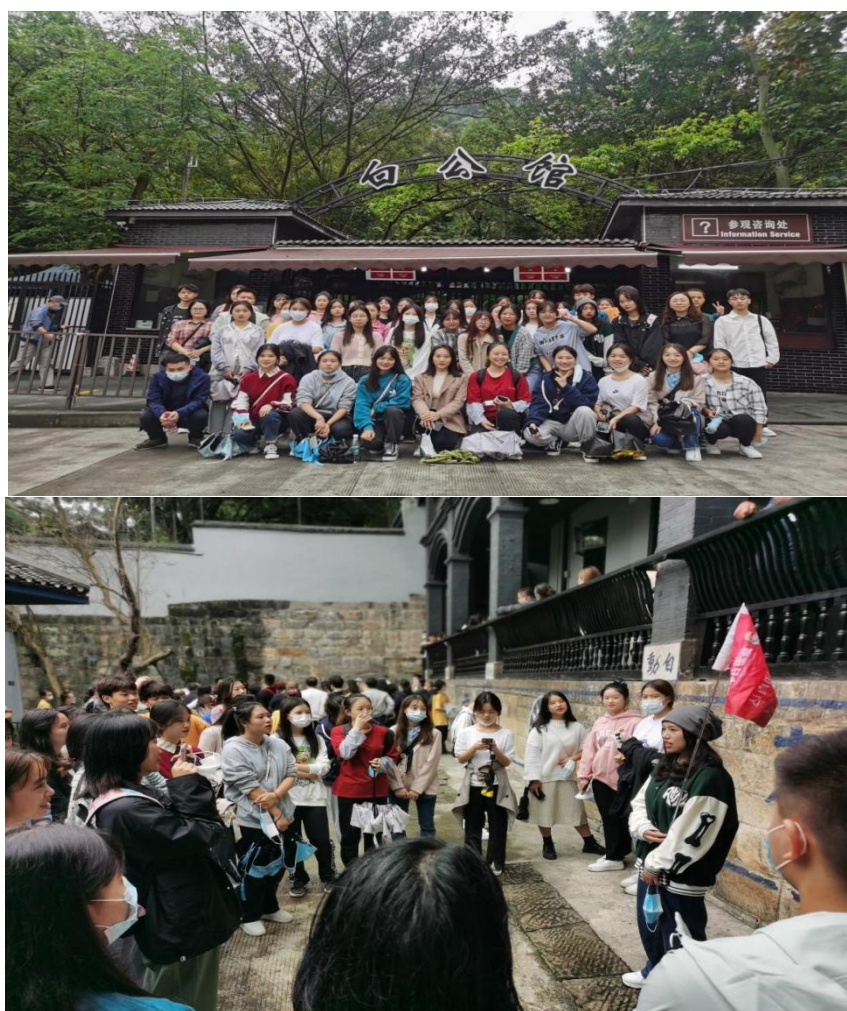
酒店管理专业群开展主城景区导游模拟实训活动

酒店管理专业群开展主城景区导游模拟实训。 10月14日,2020级旅游管理专业全体学生在校企合作单位——重庆海外旅业(旅行社)集团有限公司及老师的组织下,开展了为期1天的重庆旅游资源调查与导游技能校外实训项目。本次校外实训分为资深导游用心讲好重庆故事、宣传红色文化弘扬英烈精神、千年古镇远古巴渝、峡江风月馆藏人生、网红城市魅力重庆5个板块。