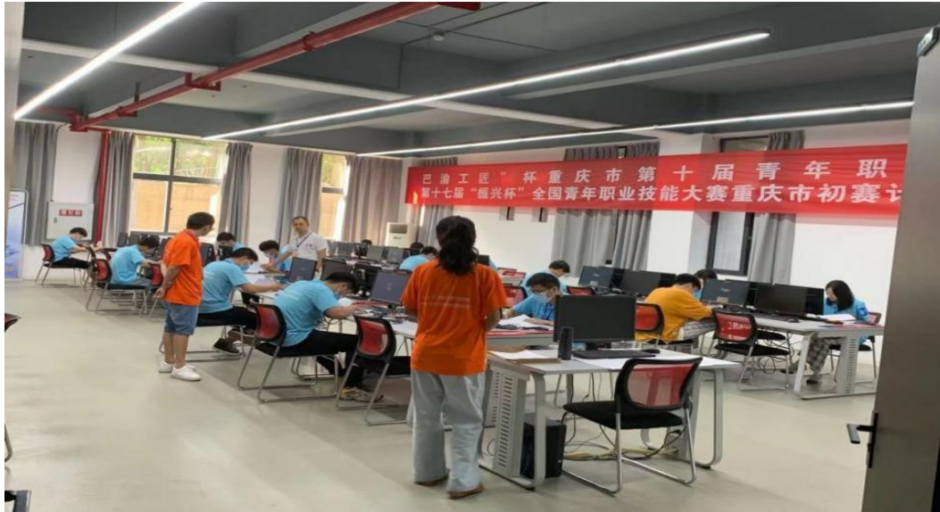
“巴渝工匠”杯重庆市第十届青年职业技能大赛暨第十七届“振兴杯”全国青年职业技能大赛重庆市初赛现场

药品生产专业群教师成绩斐然。该专业群教师荣获中国化工教育协会教学团队 1 个、教学名师 1 名；生物技术行指委 2021 年年会优秀论文奖三等奖 1 项；2 名教师受邀前往四川化工职业技术学院执裁四川省化工总控工职业技能大赛；2 名教师参加药品购销 1+X 技能等级培训。