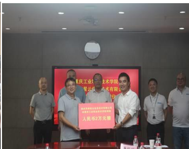
学校与重庆网御星云信息技术有限公司签约仪式现场

重庆市版权研究基地落地学校。 10月12日，重庆市版权研究基地落地重庆工业职业技术学院，授牌仪式现场，与会嘉宾开展了关于软件版权保护和软件产业高质量发展的交流研讨，就数字版权保护司法案例、区块链在数字版权中的保护等问题进行了深入探讨。