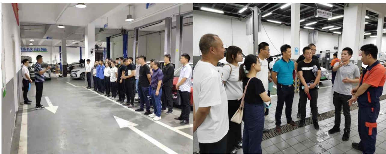
学员在博卡联汽车 4S 店实践

汽车检测与维修技术专业群完成了《汽车保险与理赔》《汽车发动机维修》《汽车系统及零部件识别》三本教材的出版工作，教师的信息化教学比例达到 80%以上。2021 年暑期国家职业技能证书汽车维修工技师、高级技师评价认定培训班圆满结束，来自 15 家重庆市企事业单位的 66 名学员参加。7 月 16 日至 7 月 22 日，开展了高职专业带头人领军能力研修——汽车制造类培训第二阶段，参培学员分别在博卡联（重庆）汽车销售服务有限公司、重庆奥洋弗客汽车销售服务有限公司进行企业实践，并于 7 月 23 日至 7 月 26 日回到学校进行专业建设实操培训、课程教学设计展示、资源库应用展示以及纯电动汽车的故障诊断与排除鉴定。