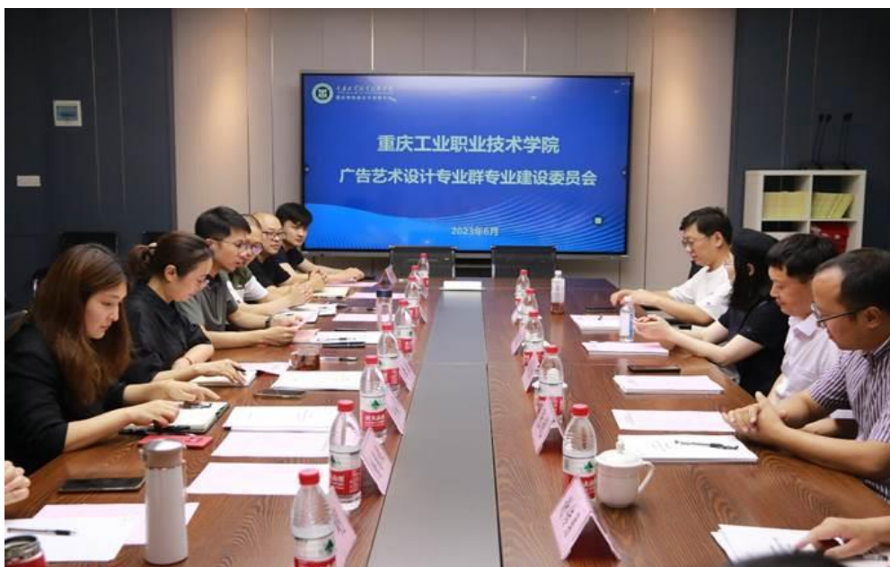
专业群专业建设委员会会议现场